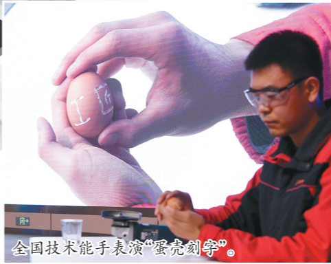
全国技术能手表演“蛋壳刻字”。