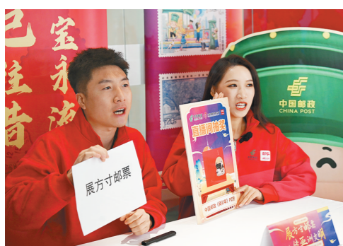
11月29日，中国2024亚洲国际集邮展览在上海展览中心开幕。图为邮乐直播间工作人员在展览上直播。

省人社厅人力资源流动管理处相关负责人介绍，陕西启用人力资源预测系统，旨在进一步为全省链主企业、用人单位、人力资源机构、各类人才和求职者搭建平台，不断推进优化人才培养、选拔、流动机制，促进人才链和产业链深度融合。