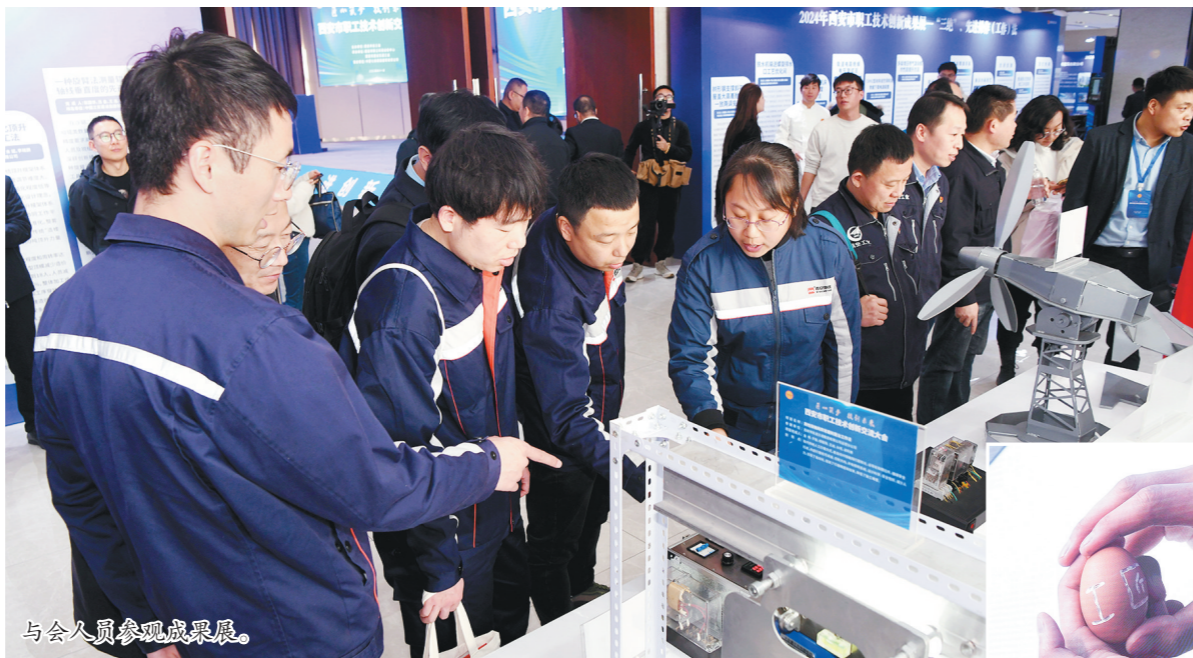
11月29日，由西安市总工会主办的西安市职工技术创新交流大会在中建七局第四建设有限公司举行。

大会上，通过图文展板、实物模型、影音视频等方式，展示了近年来全市职工的优秀成果；对2024年西安市“三绝”、先进操作(工作)法和优秀创意作品获奖职工进行表彰；多位劳模、技术能手进行绝技绝活展示。