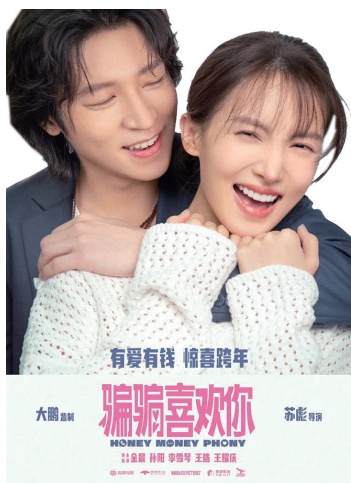
《“骗骗”喜欢你》讲述了一个骗与被骗的爱情故事。

春节档掩盖,但作为传统老档期,贺岁档在岁末年初陪伴观众,仍然具有重要意义。根据近几年的市场反馈,跨年档越来越成为贺岁档的重头戏。2023年末上映的《一闪一闪亮星星》,凭借跨年“下雪场”成功出圈,吸引了大量观众,最终票房超过7亿元。2024年,爱情片《“骗骗”喜欢你》和悬疑片《误杀3》构成了跨年档的主要格局。