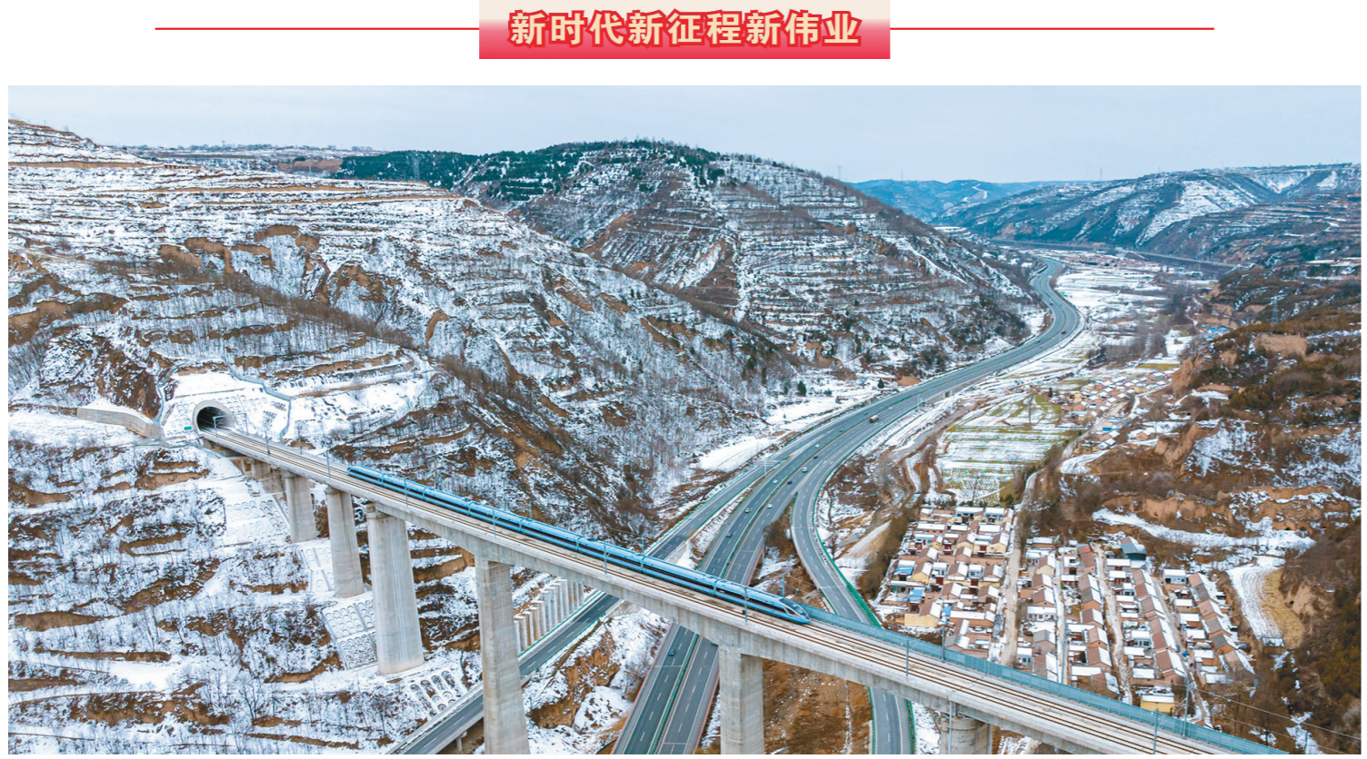
2月6日,银西高铁陕西彬州段,复兴号动车组从太峪特大桥上飞驰而过。春节假期过后,铁路返程客流强劲增长。中国铁路