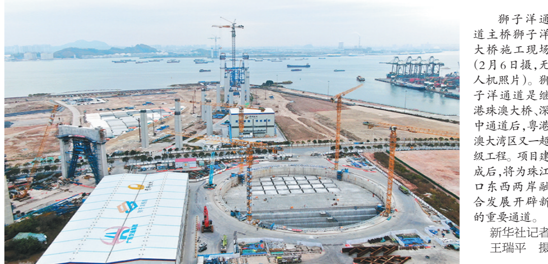
狮子洋通道主桥狮子洋大桥施工现场(2月6日摄,无人机照片)。狮子洋通道是继港珠澳大桥、深中通道后,粤港澳大湾区又一超级工程。项目建成后,将为珠江口东西两岸融合发展开辟新的重要通道。

我深知,这份报纸承载着无数像我一样普通职工的心声与梦想。它始终秉持贴近职工、服务职工的宗旨。通过她,我了解到了其他行业职工的工作日常,学到了他们的优秀经验和创新方法。未来,我期待能与《陕西工人报》有更多的交集。我愿继续用文字记录工作中的点滴,无论是成功的喜悦,还是失败的教训;用笔触描绘行业的发展,见证每一次进步与变革。我相信,在报纸的激励下,我会一天天成长,将与陕西工人报共同见证陕西职工群体的奋斗与辉煌,书写属于职工的精彩篇章。