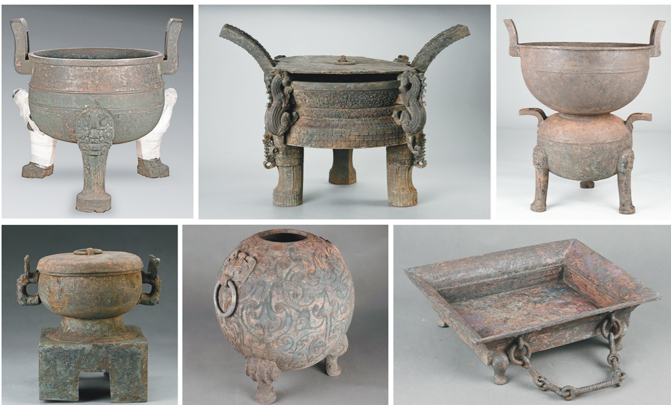
安徽淮南市武王墩战国晚期一号墓出土的铜器。(拼版照片,资料照片)