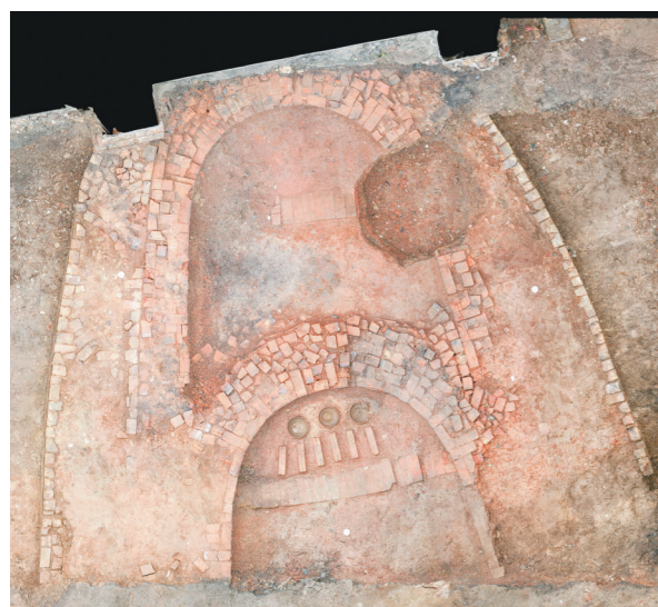
江西景德镇市落马桥清代镇窑遗址。(资料照片)