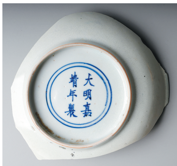
江西景德镇市天后宫出土的白釉瓷盘残片。(资料照片)