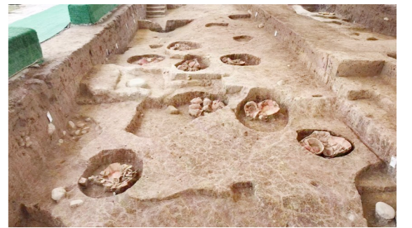
浙江仙居县下汤遗址北区人工土台及器物坑。(资料照片)

景德镇市元明清制瓷业遗址群2024年度发掘涉及14个遗址点,分别关注镇区窑业发展、原料来源产区、燃料来源产区、道路交通网络、多元宗教信仰等方面,发掘面积超过2000平方米,遗存时代从南宋晚期到近代,各发掘点均取得重要收获。对景德镇相关遗址点的发掘,厘清了从宋到清的瓷业手工业发展不同阶段在景德镇的变化情况,证实了宋朝景德镇全镇区已经存在广泛瓷器生产,发现了景德镇瓷器生产相关的不同人群来源及明代晚期景德镇瓷器大规模参与全球贸易的考古学证据,进一步证实御窑技术带动了景德镇瓷器生产技术的整体提高。