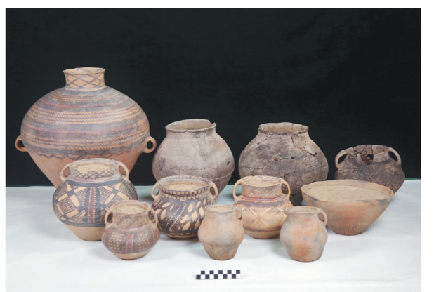
甘肃临洮县寺洼遗址出土的陶器。(资料照片)