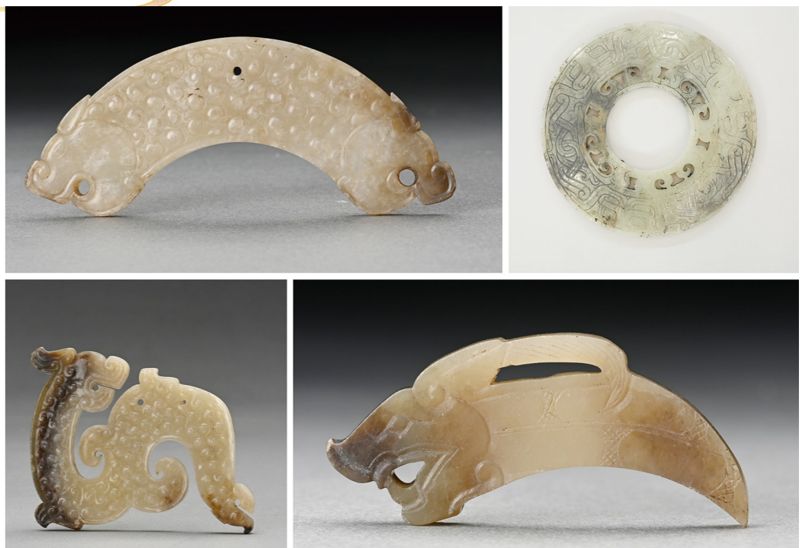
安徽淮南市武王墩战国晚期一号墓出土的玉器。(拼版照片,资料照片)