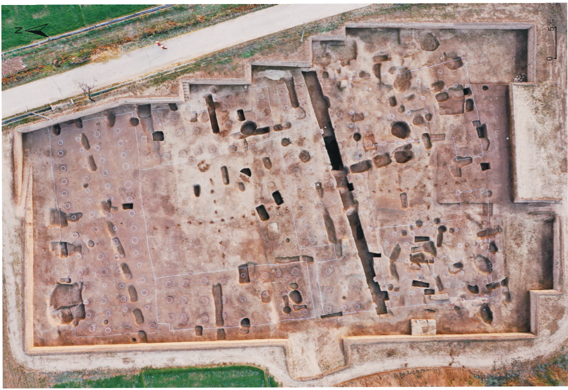
陕西宝鸡市周原遗址王家嘴一号建筑遗址。(资料照片)