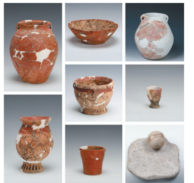
浙江仙居县下汤遗址出土的器物。(拼版照片,资料照片)