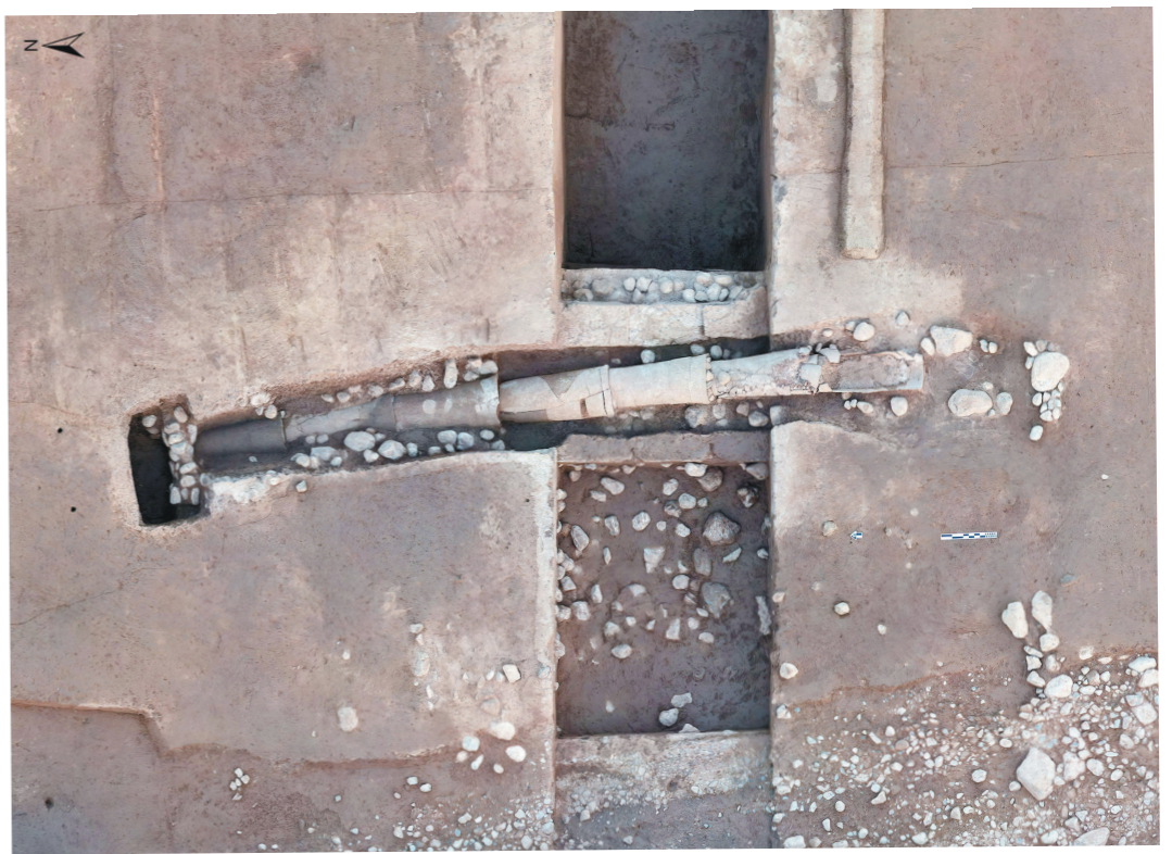
陕西宝鸡市周原遗址宫城西北角铺石道路及陶排水管道。(资料照片)