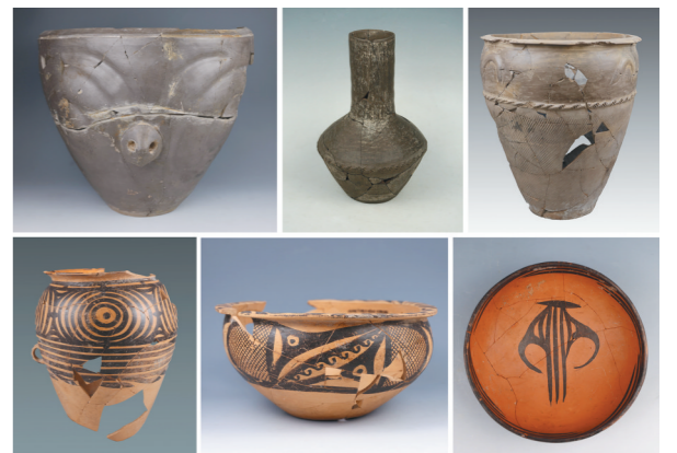
甘肃临洮县寺洼遗址出土的陶器。(拼版照片,资料照片)