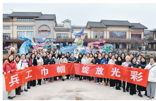
近日,中国兵器工业集团试验院工会组织女职工开展“诗经之河、礼乐之源”活动,丰富了职工精神文化生活。