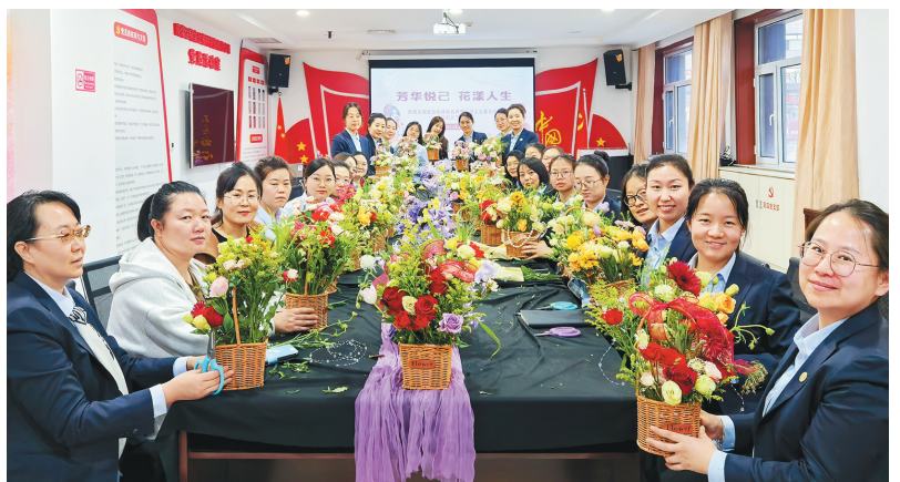
近日,陕煤运销集团榆林销售公司开展“醒春时光,向‘莓’好出发”主题活动。插花环节女职工精心挑选、细心搭配,创作出一件件精美的园艺作品。