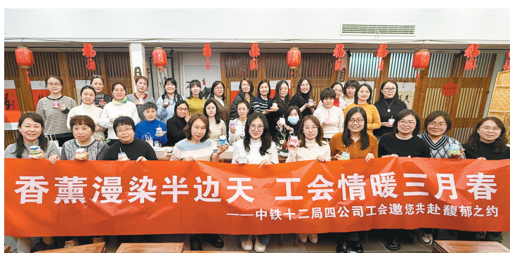
近日,中铁十二局四公司工会举办“香薰漫染半边天 工会情暖三月春”精油香薰蜡烛DIY活动,提升了女职工的幸福感和归属感。