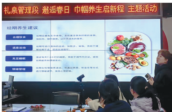
3月6日,咸阳市公路局礼泉管理段开展“三八”国际劳动妇女节系列活动之一——“邂逅春日 巾帼养生启新程”健康知识讲座。