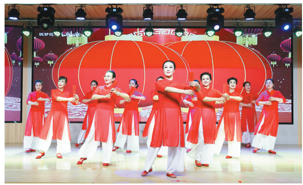
3月7日,由榆林市榆阳区总工会主办,区工人文化宫和榆林市政府机关老干部艺术团承办的“巾帼建新功 筑梦新时代”2025年“三八”国际劳动妇女节活动举行。

本次活动旨在为全区女性搭建展现风采、交流成长的平台,进一步凝聚女性力量,丰富女职工精神文化生活,展现新时代女性风采。活动设有非遗剪纸、漆扇、纸鸢等多种类型的手工DIY制作,以及踢毽子、跳绳、排球等多种类型的体育项目,增强了女职工之间的互动交流,传递了工会“娘家人”的温暖和关怀。