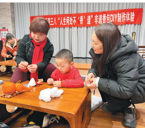
近日,陕煤澄合矿业合阳公司以“品味文化魅力 绽放巾帼风采”为主题,组织女职工和家庭走进合阳县历史文化博物馆,进行了一场别开生面的文化体验。