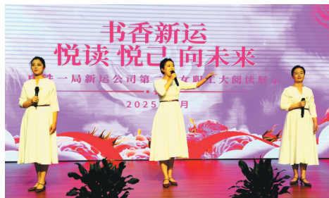
3月6日,中铁一局新运公司举行喜迎“三八”国际劳动妇女节“书香新运 悦读悦己向未来”活动。