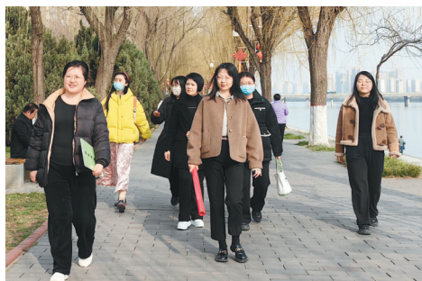
3月7日,咸阳市秦都区养老保险经办中心工会组织全体女职工,在区党建主题公园开展“巾帼风采展芳华 健步追梦新征程”主题健步走活动。