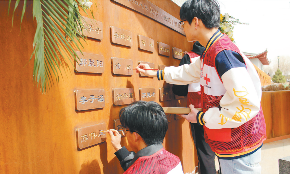
3月25日,由中国人体器官捐献管理中心、省红十字会、省卫健委、省民政厅、榆林市委、市政府主办的2025年陕西省人体器官捐献缅怀纪念活动,在榆林市的人体(遗体)器官捐献者缅怀纪念园举行。活动以“生命希望”为主题,深切缅怀勇于捐献个人器官的先行者,促进全社会形成捐献光荣的良好氛围。