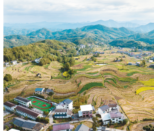
凤堰梯田景色。(资料图)

“目前我国共有38处灌溉工程被成功收录为世界灌溉工程遗产,这些遗产是古代灌溉工程可持续利用的典范,具有极高的历史、文化和科学价值,是珍贵且独具特色的文化遗产。”水利部农村水利水电司二级巡视员党平说。