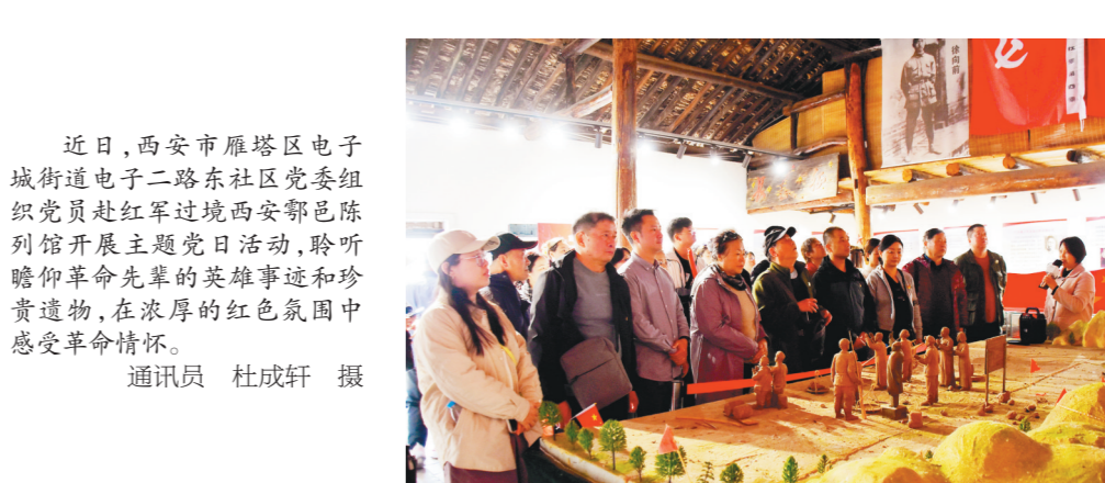
近日,西安市雁塔区电子城街道电子二路东社区党委组织党员赴红军过境西安鄠邑陈烈馆开展主题党日活动,聆听瞻仰革命先辈的英雄事迹和珍贵遗物,在浓厚的红色氛围中感受革命情怀。

本报讯(通讯员 毕华玉 张亚明)近日,为持续推进“体重管理年”行动,陕煤陕西省煤层气钻井分公司积极倡导“大健康”理念,深入调研、认真谋划,全力为职工打造个性化体重管理方案,切实保障职工健康。 钻井分公司工会为职工食堂配备“一秤一尺一日历”专属健康工具。其中,智能体脂秤成为职工了解身体状况的“得力助手”,它不仅能精准测量体重,还能借助配套手机APP,形成详细的身体成分分析报告,让职工对自身健康状况了如指掌。职工食堂在显眼位置摆放腰围尺,方便职工随时测量,时刻关注腰围变化。一人一张的体重管理日历则成了职工的“健康档案”,通过观察数据趋势,能及时洞悉身体变化,灵活调整体重管理计划。 运动与饮食是体重管理两大关键要素,为此,该分公司一方面倡导职工开启“晨练模式”,配备跳绳、毽子等简易健身器材,鼓励职工清晨到食堂附近空地运动后再享用早餐,以活力满满的状态开启一天工作。另一方面,要求食堂遵循少油、少盐、清淡饮食原则,为职工烹制营养健康的各色菜肴,让职工吃得健康又安心。