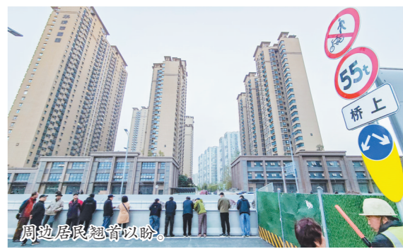
周边居民翘首以盼