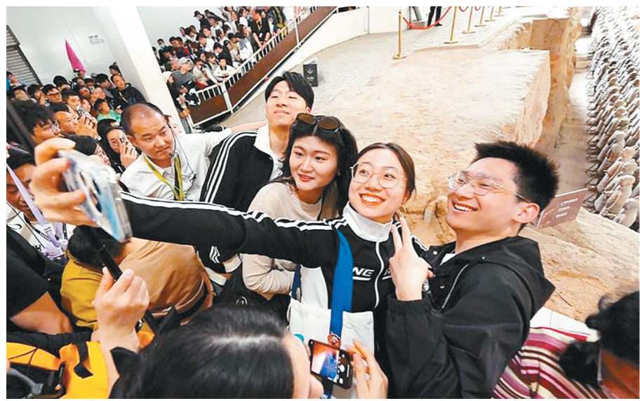
秦始皇帝陵博物院游人如织。

“节气+文旅”模式是旅游企业创新产品的重要抓手之一,在激活文化传承活力的同时,也将进一步打破边界,为传统节气旅游市场注入新动能。