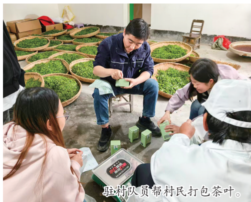
驻村队员帮村民打包茶叶。

“多亏了供电段的驻村工作队,茶叶卖到了城里,收入实打实增加了!”拿到茶款的农户们笑容满面,连连道谢。 截至目前,已帮助两村30户茶农销售春茶8万余元,户均增收2700余元,让漫山遍野的“绿叶子”,真正变成了茶农口袋里实实在在的“红票子”。 产业兴则乡村兴。西安供电段驻村工作队负责人表示,未来将持续聚焦茶产业发展和群众增收,完善“产销对接+品牌推广+情感联结”长效机制,深挖本地生态与茶文化潜力,切实将绿水青山转化为增收实效,让广大茶农在致富路上走得更稳、更远。